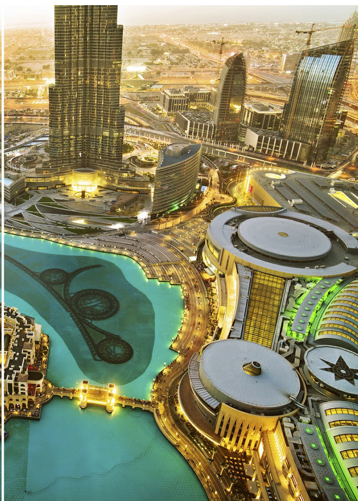
Ultra 4K HD