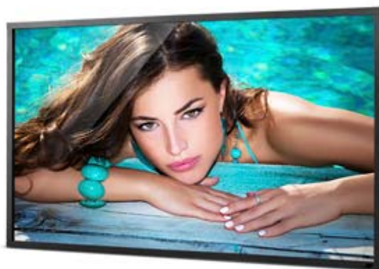
Full HD Resolution