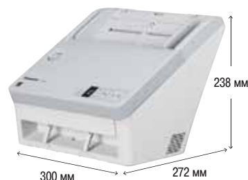
Планшетный сканер KV-SS081