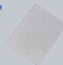
Папка для сканирования KV-SS076

*100 - 600 dpi (с шагом 1 dpi) (ч/б и цветное сканирование)